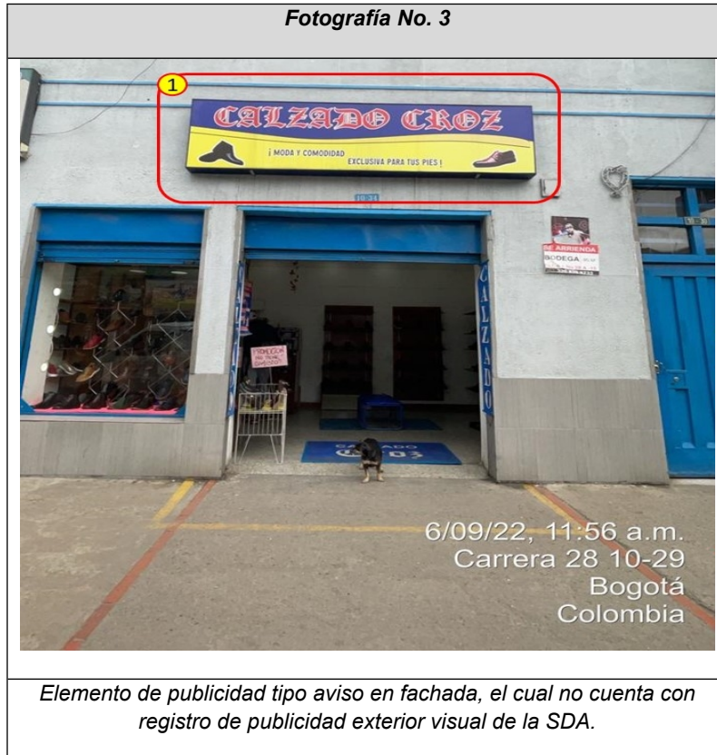
Fotografía No. 3